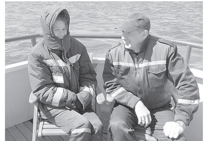
Медицина катастроф осталась невостребованной.